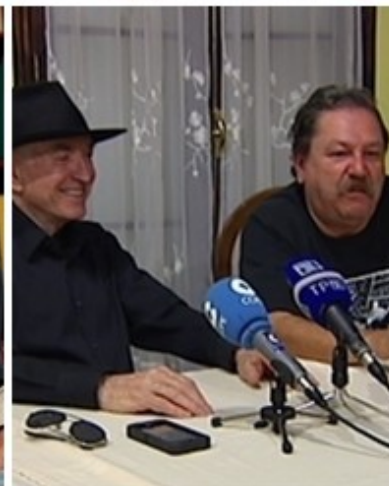
El público llena la carpa de presentaciones de la Semana Negra. Abajo, Joaquín Sabina interviniendo. A la derecha, el escritor de género criminal Paco Ignacio Taibo II, fundador de la Semana.